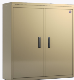
Met dubbele deur en 2 compartimenten