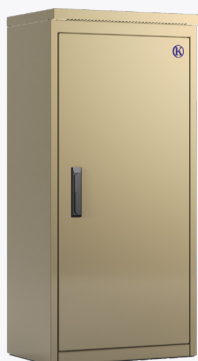
Met enkele deur